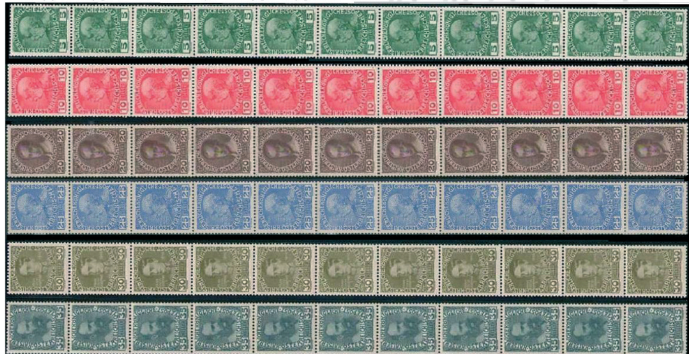
Obr. 2 Ukázková jednorázová známka ze známkových rolí tiskových strojů.

Barva umožňovala vyrábět známky rychle a levně. Následně v 20. 11. 1913 byly vzhledem k potřebě vydávání známek ve svitcích na oboustranně od 1. 12. 1913 v přípojkách poštovních úřadů. Barva se používala na nominální hodnotu známek bez přípojek. Pásky, stejně s výjimkou svitků byly vždy do konce započteny. Barva byla držena po 1000 ks a hodnot 3, 5 a 10 h a po 500 ks a hodnot 20, 25, 30 a 35 h. Barva byla opatřena lepidlem a nálepkou, např. 1000 Stück